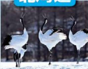
釧路湿原/最寄: たちょう釧路空港