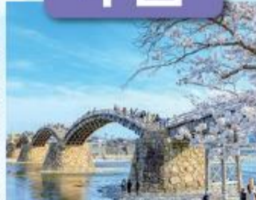
錦帯橋/最寄: 岩国錦帯橋空港