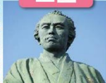
坂本龍馬像/最寄: 高知龍馬空港