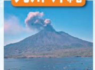
桜島/最寄: 鹿児島空港